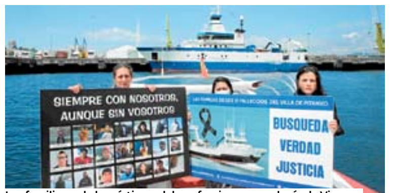
Los familiares de las víctimas del naufragio, ayer, en la ría de Vigo. DP

La Gladiator Race reúne a 1.400 atletas en la Illa das Esculturas > 42-43